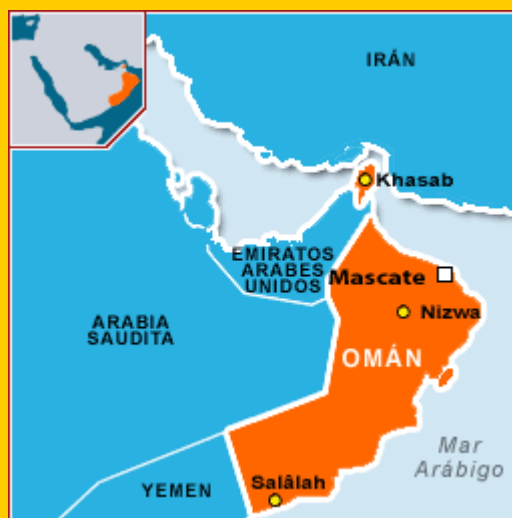
Mapa de la ruta Vídeo