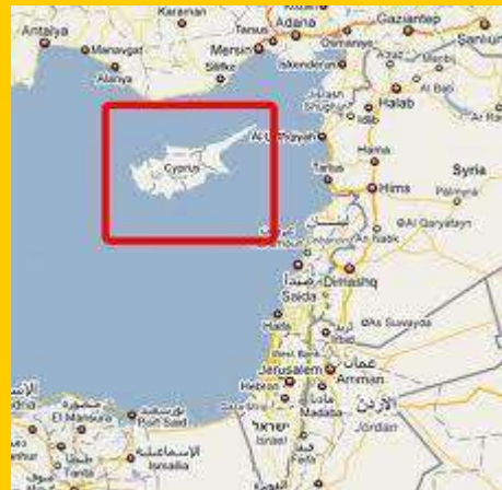
Mapa de la ruta