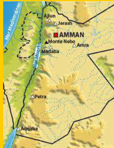
Mapa de la ruta