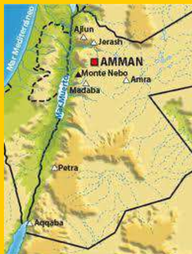
Mapa de la ruta