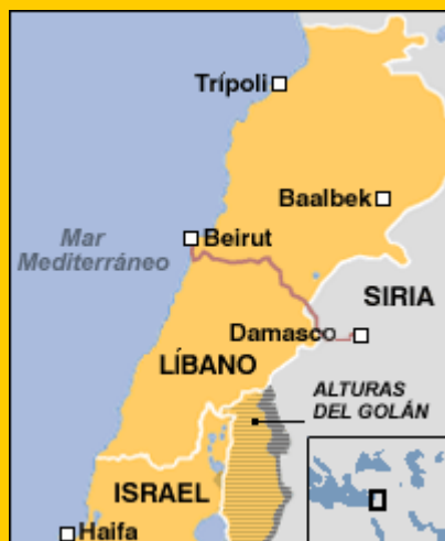
Mapa de la ruta