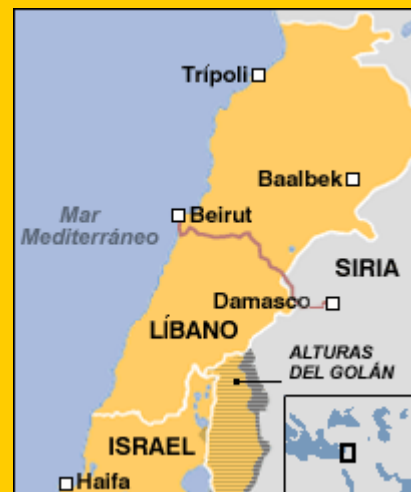
Mapa de la ruta