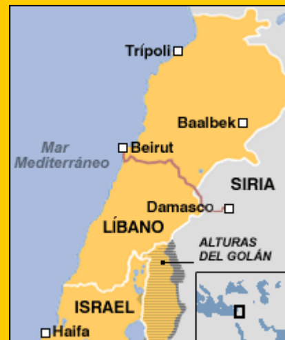
Mapa de la ruta