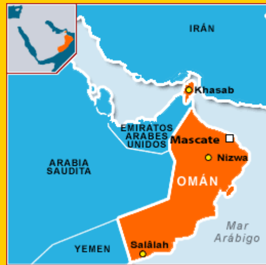
Mapa de la ruta