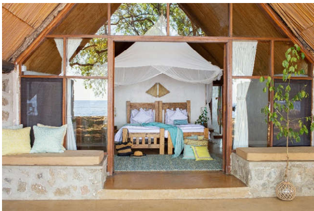
LUKUBA ISLAND LODGE