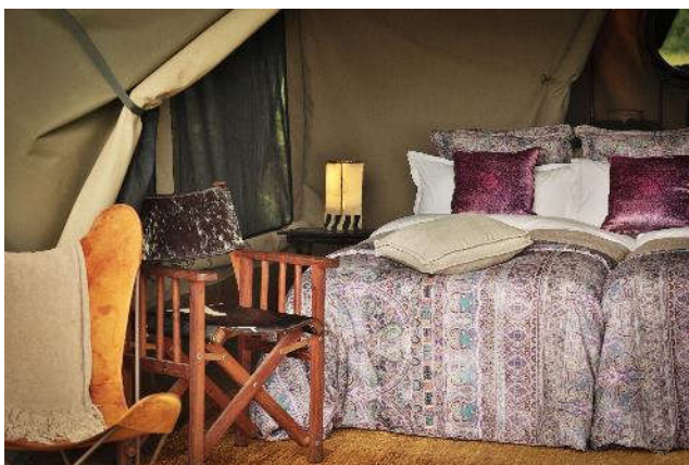
PAKULALA NGORONGORO SAFARI CAMP