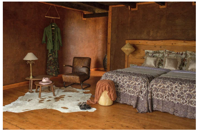
MASAI MARA OLENGOTI SAFARI CAMPS