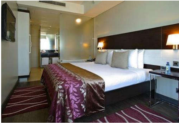
NAIROBI - EKA HOTEL