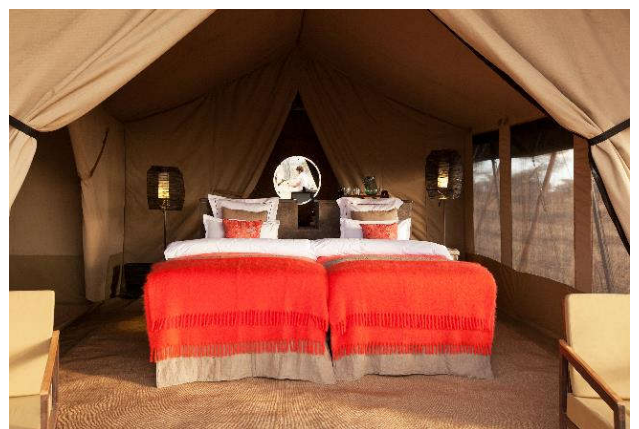
PUMZIKA SERENGETI SAFARI CAMP